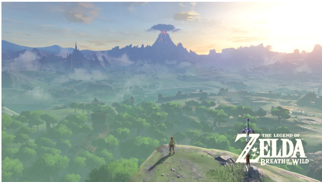
Abb. 5: Screenshot aus Z-BotW, URL: https://www.youtube.com/watch?v=endKuMMZeFE 9:24 [06.03.2018]

Das Ziel des sinnlichen Genießens ist den Fokus von stressauslösenden Situationen zu nehmen und darauf zu konzentrieren, was für den Körper und die Psyche als belohnend empfunden wird (die Zufriedenstellung der Urinstinkte).