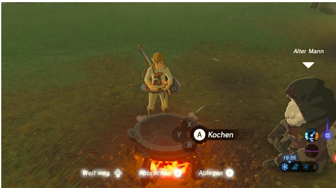
Abb. 7: Screenshot aus Z-BotW, URL: https://www.youtube.com/watch?v=dP6zXKgC54M 4:38 [06.03.2018]

Die Motivation zur Nutzung dieser Spielmechaniken wird ausgelöst, indem die Überlebenschance durch die Aufbesserung des Equipments und/oder die Eigenschaften des Spielcharakters gesteigert oder sozialer Bedürfnisse durch Interaktionen mit Spielcharakteren befriedigt werden.