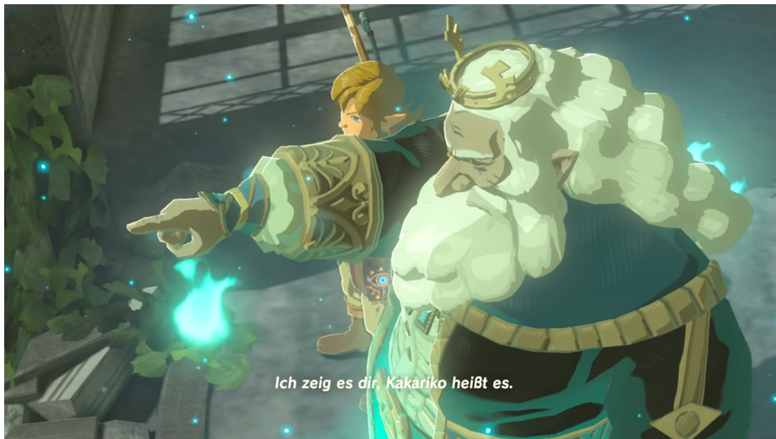
Abb. 4: Screenshot aus Z-BotW, URL: https://www.youtube.com/watch?v=Vaj9wRDjcDQ 3:43 [06.03.2018]

"Das Prinzip des sozialen Lernens beschreibt die Tatsache, dass Menschen stellvertre- tend lernen können, indem sie das Verhalten anderer Personen beobachten und erfolgrei- che Handlungsstrategien des beobachteten Modells in ihr eigenes Handlungsrepertoire übernehmen". 30