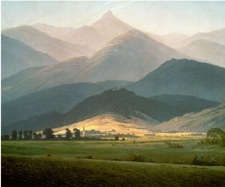
Abbildung 6: Riesengebirgslandschaft , Caspar David Friedrich (1810), URL: https://www.kunstkopie.de/a/caspar_david_friedrich/riesengebirgslandschaft-1.html

menschlicher Zivilisationen, die einzigen hörbaren Geräusche kommen vom sich bewegenden Spielcharakter (z.B. seine Schritte auf dem Untergrund oder wenn etwas bewegt wird) und von der Höhle selbst (ein tiefer Ton gleich dem Grummeln eines Berges, wenn ein Wind über dessen Oberfläche hinwegzieht). Die Höhle wird verlassen und mit einer narrativen Cut-Scene 34 läuft der Spielcharakter auf einen Felsvorsprung zu und bleibt stehen, Vogelgezwitscher, Gras und Windgeräusche sind zu vernehmen. Ein Kameraschwenk offenbart die Spielwelt Hyrule, das durchzogen ist von Bergen, Flüssen, Seen, Vulkanen, Wüsten, Wäldern, Steppen und Wiesen. Vereinzelt sind auch architektonische, teils Ruinen-ähnliche Strukturen zu erkennen (Abb.5). Die gewählte Lichtsituation lässt die Landschaft in einem warmen gelb-Ton erstrahlen und die erhabene und beruhigende Wirkung der Szenerie ist mit Landschaftsmalereien der Romantik wie den Werken von Caspar David Friedrich zu vergleichen (Abb.6). Erst in dieser Cut-Szene setzt mit dem Laufen und dem Kameraschwenk zunächst eine zarte, dann in Intensität und Lautstärke steigende Klaviermelodie ein und verklingt genauso zart, wie sie gekommen ist.