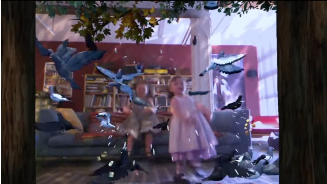
Abb. 2: Screenshot aus Happy Action Theater , URL: https://www.youtube.com/watch?v=N2wzUppGTN4 [06.03.2018]

Ein weiteres Beispiel ist das Kinect-Spiel Happy Action Theater . Dabei handelt es sich um eine kommerzielle, der Unterhaltung gewidmete Produktion des Unternehmens Double Fine. Es besteht aus einer Sammlung kleiner Party-Spiele, in denen die Bewegungen des Spielers über eine Kamera erkannt werden und durch darauf reagierende Ereignisse auf dem Bildschirm dargestellt werden. So können beispielsweise Luftballons zum Platzen gebracht werden, Feuerwerk wird durch Körperbewegungen gezündet oder Vögel fliegen und sammeln sich um den sich bewegenden Avatar des Spielers. Die Jackson School in Victoria von Australien hat die therapeutischen Wirkungsweisen dieser Spiele erkannt. Die Spiele besitzen eine einfache Bedienung mit der Möglichkeit zu Interagieren (z.B. mit Luftballons), was ein sofortiges Feedback (bestehend aus zumeist bunten und sich bewegenden Objekten) auslöst. Kinder mit Autismus haben Schwierigkeiten sich auf Gespräche zu konzentrieren und mit anderen Menschen verbal in Verbindung zu treten. Diese visuellen Darstellungen und Handlungen erleichtern es diesen Kindern sich mit diesen zu identifizieren und darauf zu konzentrieren. Sie