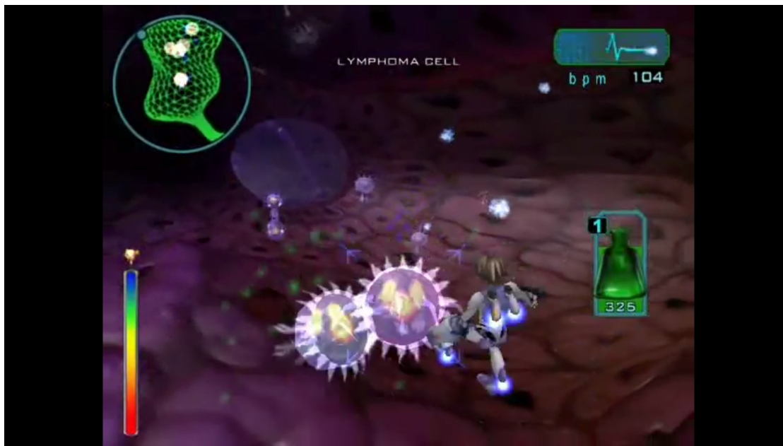
Abb. 1: Screenshot aus Re-Mission , URL: https://www.youtube.com/watch?v=VfPBGndcTNo [06.03.2018]

Remission ist ein von Hopelab 2006 veröffentlichtes Serious Game, das gezielt von Ärzten, Psychologen und Game Designern für Krebspatienten im Kindesalter entwickelt wurde. Als Third-Person Shooter steuert der Rezipient eine Spielfigur, mit dessen Hilfe Tumorzellen im Körper bekämpft werden (Abb.1). Dem Spieler stehen dabei zahlreiche (für die Krebs-Bekämpfung typische) Waffen zur Verfügung (Antibiotika, Chemotherapiepräparaten und einige weitere medizinische Gegenstände), die eingesetzt werden können. Während dem Spielverlauf wird der Spieler umfangreich über die Krankheit aufgeklärt. Dabei findet mit Cut-Szenen und Game-Mechaniken eine direkte Interaktion zwischen Spielfigur und Spieler statt, dem stetig das Gefühl vermittelt wird den Krebs besiegen zu können. Auf diese Weise lernen die Kinder positiver mit der Krankheit umzugehen, wodurch auch der psychologische Heilungsprozess angesprochen wird. 20 21